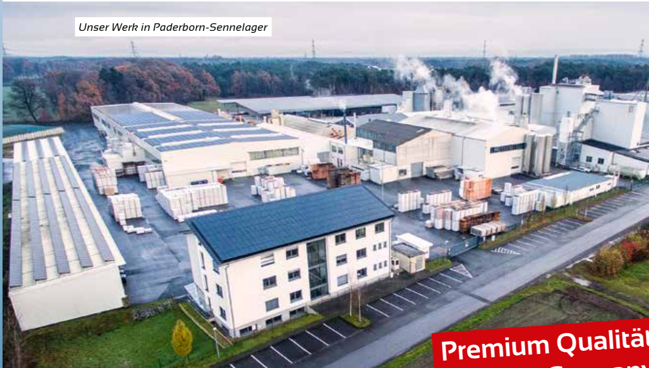
Unser Werk in Paderborn-Sennelager

redstone ist innovativer Hersteller von einem effizienten Produktsortiment für die Schimmel- und Feuchtesanierung sowie die energetische Sanierung durch Innendämmung und zur Steigerung des Wohnkomforts. Ergänzt und optimiert werden die Systeme durch mineralische und umweltfreundliche Wandbeschichtungen.